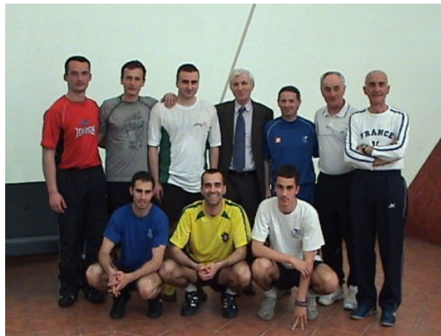
Φοιτητές της Ακαδημίας με τους καθηγητές τους

Rajko Mitic Πρώην προπονητής της εθνικής ομάδας ποδοσφαίρου της ενωμένης Γιουγκοσλαβίας Stjepan Bobek Πρώην προπονητής της εθνικής ομάδας ποδοσφαίρου της πρώην Γιουγκοσλαβίας και προπονητής του ΠΑΝΑΘΗΝΑΪΚΟΥ Srdjan Mrkusic προπονητής, πρώην παίχτης εθνικής ομάδας