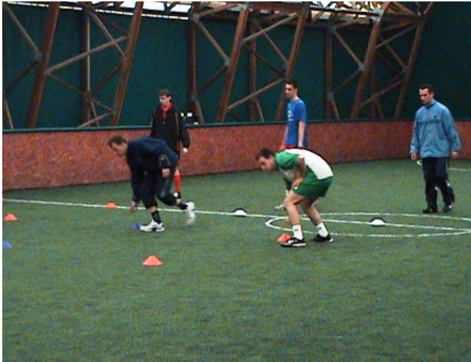
Φοιτητές της Ακαδημίας κατά τη διάρκεια της πρακτικής τους