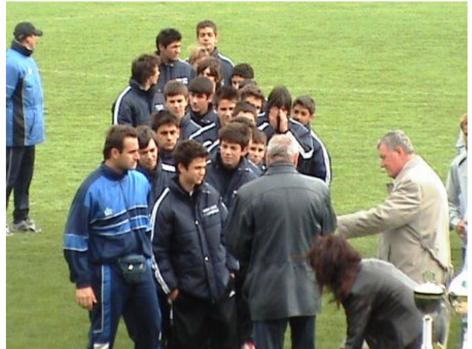
Η Ελληνική ποδ. ομάδα κατά την απονομή στο διεθνές τουρνουά Βελιγραδίου, Απρίλιος 2006